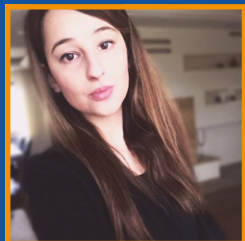
KATARZYNA SKONECZNA FUNDACJA SHP